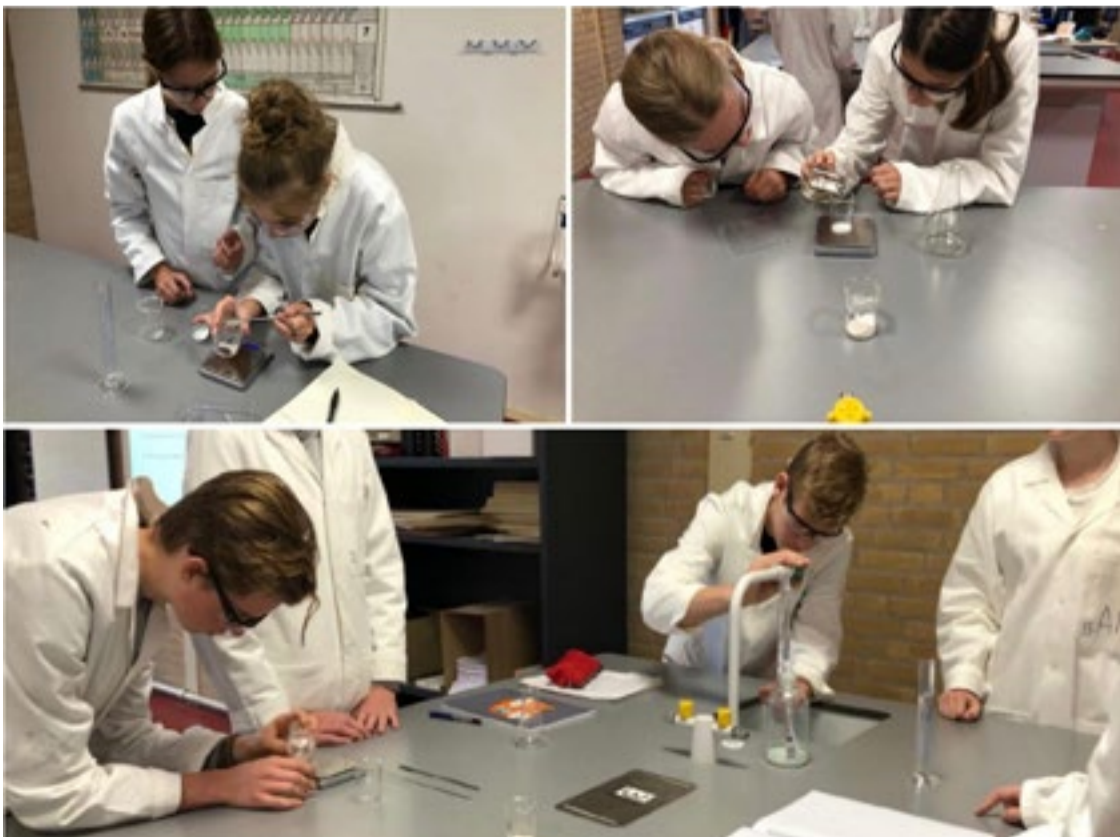
Leerlingen worden uitgedaagd om zelfstandig te werk te gaan