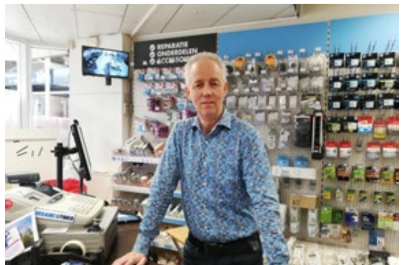
"Ik houd me graag bezig met het besturen van stichtingen of verenigingen"

"Ik vind het zeer belangrijk om lokaal samen te werken. Vandaar dat het MKB Zevenaar de actie 'Koop Lokaal' heeft opgericht. Dan worden niet alleen detailhandels en ondernemers gesteund, maar ook de voetbal- of hockeyclub die gesponsord wordt door al die winkels. We worden er met zijn allen beter van."