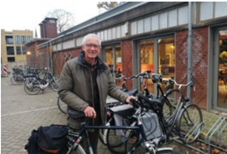
"We hebben al een aantal vervangers op het oog"

De PRZ heeft verschillende doelen. Zo willen de leden de zelfredzaamheid van burgers vergroten en proberen ze het beleid van de gemeente via adviezen te verbeteren. "Het gaat erom dat je de dingen goed regelt, dat je mensen wat vrijheid en mogelijkheden kunt", legt Donker uit. "Als participatieraad beoordelen we het beleid en praten we erover met ambtenaren. Uiteindelijk kijken we of het beleid ook echt werkt." Donker is in die acht jaar altijd erg blij geweest met zijn collega's. Zij zijn allemaal onafhankelijk, maar staan op hun eigen manier midden in de samenleving. "We hebben gezocht naar verschillen in afkomst, houding, gedrag en interesses. Dat heeft heel goed uitgepakt. Als voorzitter zorg ik dat iedereen de ruimte