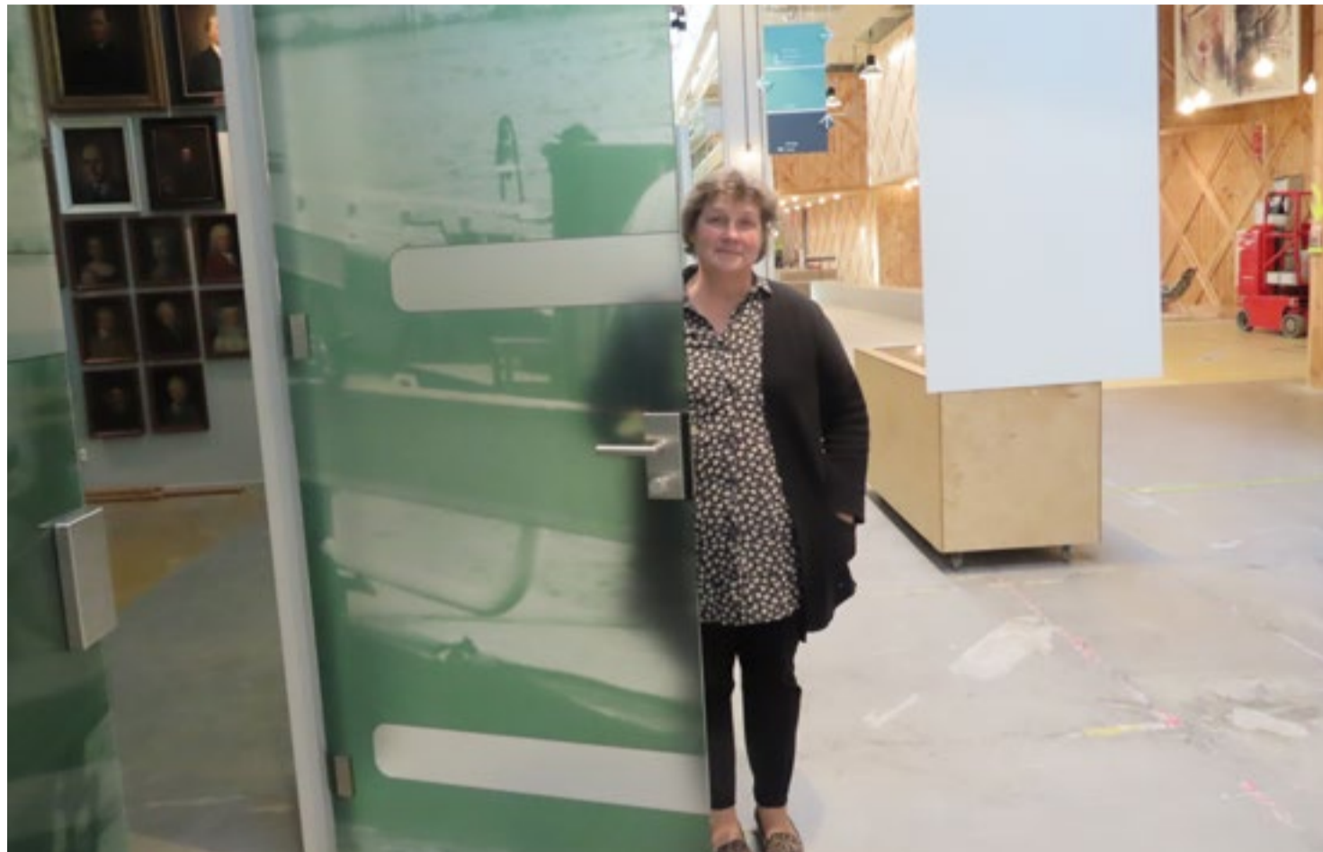
"Ik vind het geweldig dat we in een omgeving zitten met heel veel dynamiek"

De wensen en interesses van het publiek staan centraal in het vernieuwde Liemers Museum. De bewaarfunctie, het oorspronkelijke doel, is naar de achtergrond verdwenen en heeft ruimte gemaakt voor de beleeffunctie. "En dat terwijl we met 340 m2 zelfs iets minder ruimte hebben dan voorheen." Uitgangspunt is niet de Nederlandse geschiedenis; de Liemerse hoogtepunten vormen de basis, daaraan wordt de vaderlandse historie gekoppeld. Precies andersom dus. In de zoektocht naar het op een moderne manier ten-