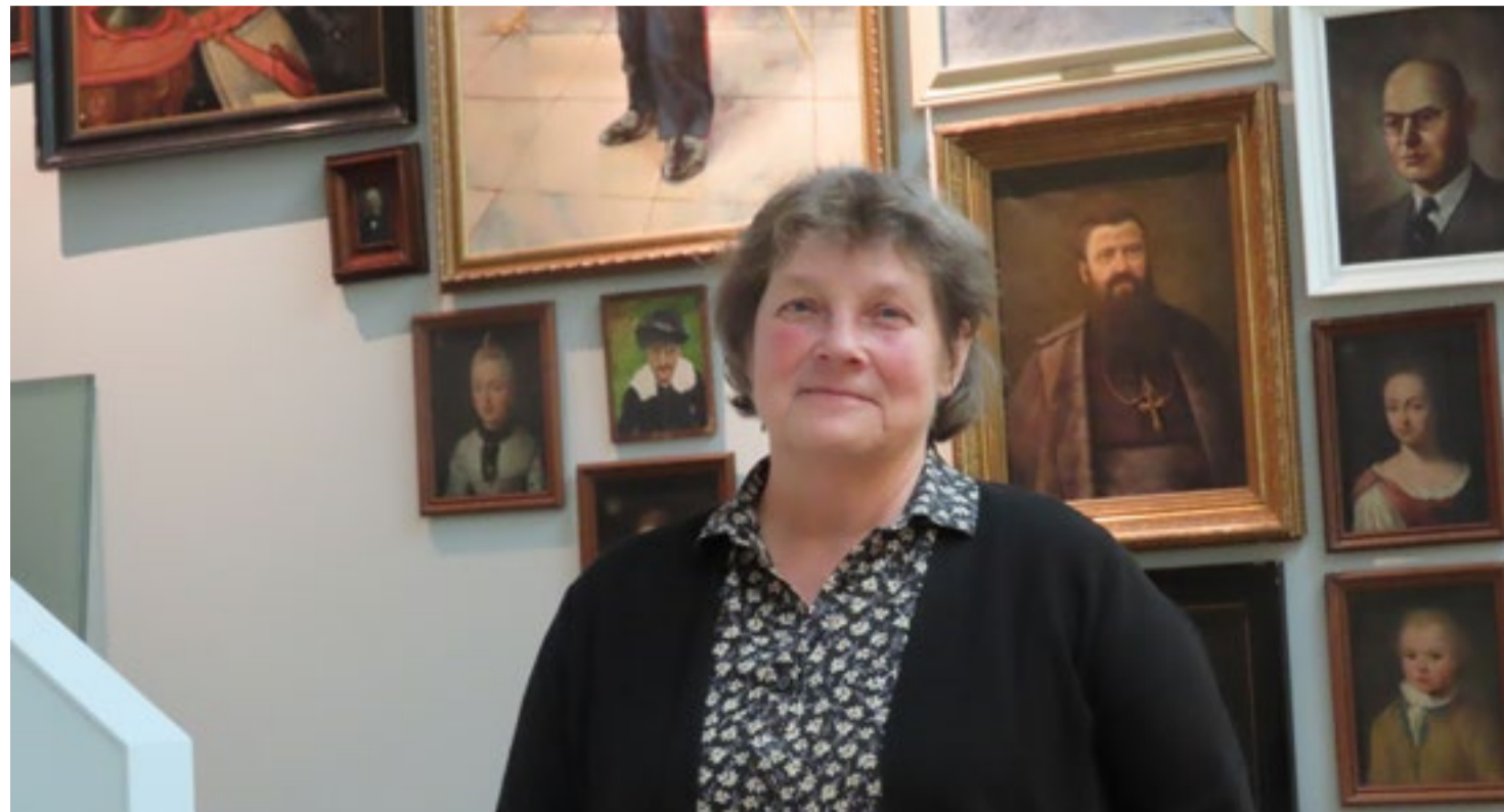
"Mensen zullen verrast zijn"